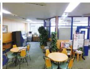
ラウンジ (約144平方メートル) ・テーブル個数:4個・椅子個数:20脚 ・50インチ液晶テレビ・DVDプレイヤー